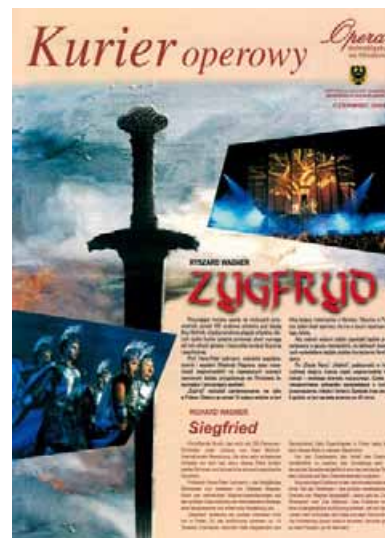
„Pierścień Nibelunga” Wagnera