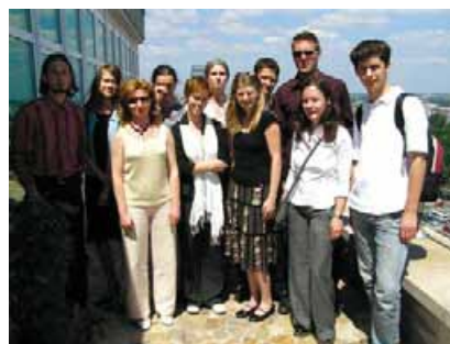
Spotkanie ze stypendystami FWPN

FWPN stara się utrzymywać kontakt z wciąż jeszcze stosunkowo niewielką liczbą stypendystów. W 2005 roku zaprosiła do Warszawy stypendystów wspólnego programu GFPS i FWPN oraz uczestników programu stypendialnego „Germanistyka dla niewidomych na Katolickim Uniwersytecie Lubelskim”.