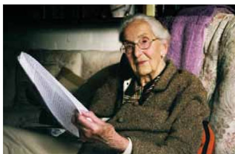
65 Film dokumentalny „Bitwa o Warszawę”