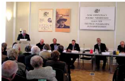
177 Uroczystość z okazji 15 rocznicy śmierci Horsta Bieńka