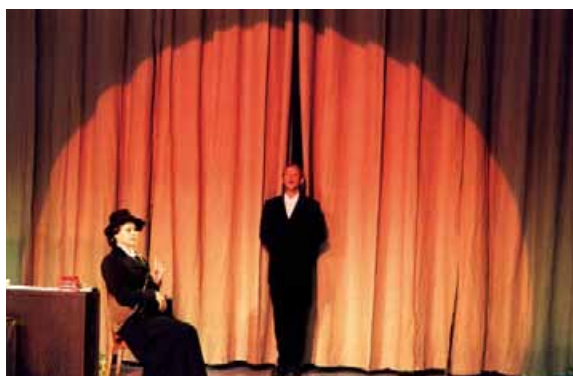
142 Festiwal baz@rt. de/ch – prezentacje