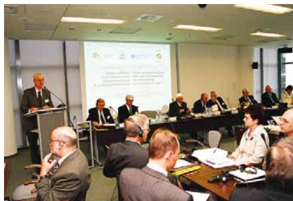
Konferencja gospodarcza w Centrum Konferencyjnym FWPN

RK: Niemcy są z ekonomicznego punktu widzenia najbardziej znaczącym krajem dawnej piętnastki UE, Polska – największym spośród nowych krajów, które przystąpiły do UE w 2004 roku. Już choćby ze względu na tę specyficzną pozycję oba państwa ponoszą szczególną odpowiedzialność za zjednoczoną Europę. Zgodnie z Traktatem z Nicei Polska ma w Radzie Ministrów UE 27 głosów, czyli niemal tyle samo, co Niemcy, Francja, Włochy i Wielka Brytania, dysponujące 29 głosami. Z tego wynika dla Polski także duża odpowiedzialność polityczna za przyszły kształt Unii.